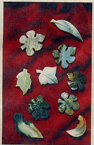
Ezek az emléke eltett régi szép darabok a nagymama kincsdobozából kerültek elő

Imre Károly 1952-ben, akkor váltotta ki az ipart, amikor mindenki más szabadult tőle. A szegedi felső-ipariskolában végzett gép- és elektrotechnikusnak, majd tengerészisztnek kevés volt a világtengerek nyújtotta szabadság is: teljes függetlenségre vágyott.