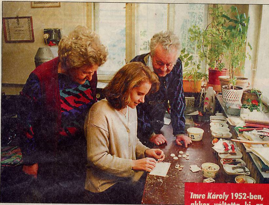
A nagyszülők ma már büszkébbek unokájuk tehetségére, mint saját szakmai múltjukra